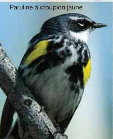
Paruline à croupion jaune