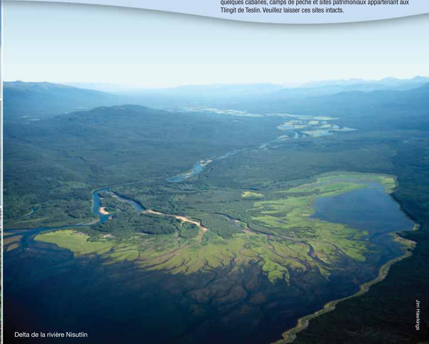
Delta de la rivière Nisutlin