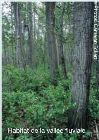
Habitat de la vallée fluviale