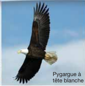
Pygargue à tête blanche